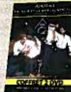
Coffret DVD 1+2

"Mon objectif est de proposer des thèmes de travail à partir d'une attaque et d'en décliner toutes les variations, avec le souci constant de n'utiliser que des techniques d'Aïkido." Christian Tissier